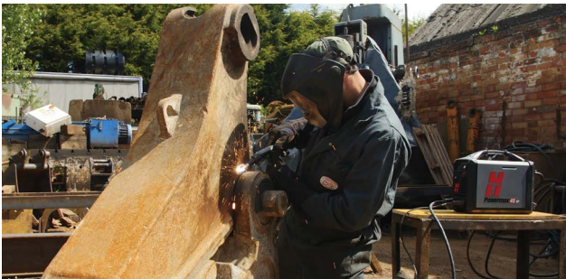
Manutenzione e riparazione